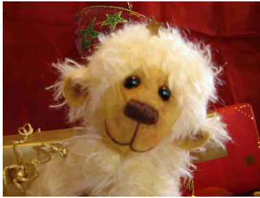
Größe ca. 18 cm